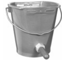
Figuur 3. Kunststof kalveremmer met speen € 10 euro. 14

Deze emmer dient opgehangen te worden op hoogte van de merrie-uier, zodat het natuurlijke zoveel mogelijk wordt nagebootst. Zo wordt ook de kans op verslikking bij het veulen kleiner. Om die reden heeft deze kalveremmer de voorkeur over een gewone emmer/bakje. Het veulen drinkt uit deze speen-emmer en zal daarom minder snel naar de mensen toetrekken voor voer.