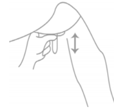
Figuur 1. melken

Geef het moederloze veulen als het kan echte merriebiest. Melk de gestorven merrie nadat ze is overleden om het veulen toch een goede start te geven. Een handige methode is het 'strippen' van de merrie-uier (figuur 1.) Met twee platte vingers aan weerszijde van de uier kan de melk naar beneden worden geduwd, waardoor het uit de speen loopt. Geef een veulen nooit water of gewone melk voordat het biest heeft gehad.